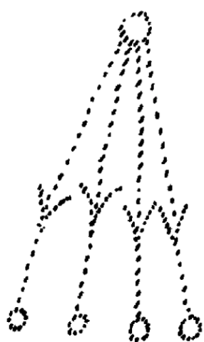
Anima di gruppo degli uomini

Figuriamoci un'accolta di uomini che sentono in loro stessi di avviarsi a una sempre maggiore individualizzazione. Non potrà nascere il pericolo di un sempre crescente spezzettamento tra gli uomini? E' venuto il tempo in cui essi non tollerano neanche più un accordo e ognuno vuole avere la propria opinione, la propria religione. C'è chi considera essere un ideale quello che si abbia ognuno un parere, un'opinione sua propria. Ma non è così. Se invece gli uomini traessero le loro opinioni maggiormente dal loro intimo, arriverebbero a opinioni a tutti comuni. Interiormente noi riconosciamo per esempio che 3 \times 3 = 9 oppure che i 3 angoli di un triangolo sono uguali a 180 gradi. Questo è un riconoscimento intimo, e tutti questi riconoscimenti intimi sono tali che per essi non occorre punto mettere ai voti le opinioni. Tutte le verità spirituali sono così fatte. Gli insegnamenti della Scienza dello Spirito, l'uomo li ravvisa mediante le sue facoltà interiori. L'interiorizzazione conduce l'uomo a pace e armonia perfette. Non possono darsi due opinioni su di una cosa senza che una sia errata. L'ideale sta nella interiorizzazione massima, e ciò appunto è quello che conduce alla vera pace, all'intima concordia.